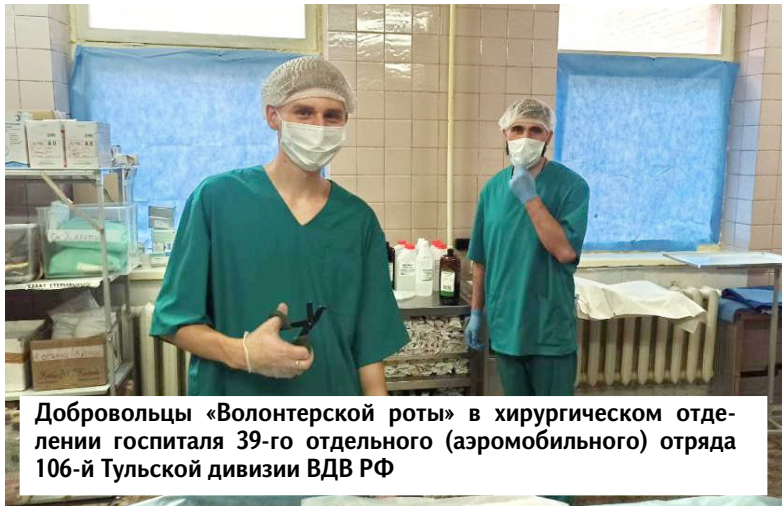
Добровольцы «Волонтерской роты» в хирургическом отделении госпиталя 39-го отдельного (аэромобильного) отряда 106-й Тульской дивизии ВДВ РФ

— В ходе общения с бойцами открылось то, что на линии соприкосновения СВО очень ценятся маскировочные сети, которые изготавливаются и в нашем районе. Поскольку электронные системы дронов могут считывать узор штатных средств маскировки и навредить средства поражения. Изготовленные же вручную средства маскировки в данном аспекте наиболее надежны. Даже новую камуфляжную одежду бойцы стараются застирывать, чтобы избежать обнаружение на поле боя. Поэтому в моих планах организовать билибинскую группу «Волонтерской роты» и «Молодой гвардии», чтобы координировать помощь бойцам СВО, в том числе формировать группы добровольцев для гуманитарной деятельности. Впечатления от поездки настолько повлияли на меня, что я решил перейти работать в ЦДО, где есть возможность практически заниматься целевой подготовкой молодежи для служения Отечеству по самым разным направлениям, а не только исключительно спортивному, — подытожил волонтер.