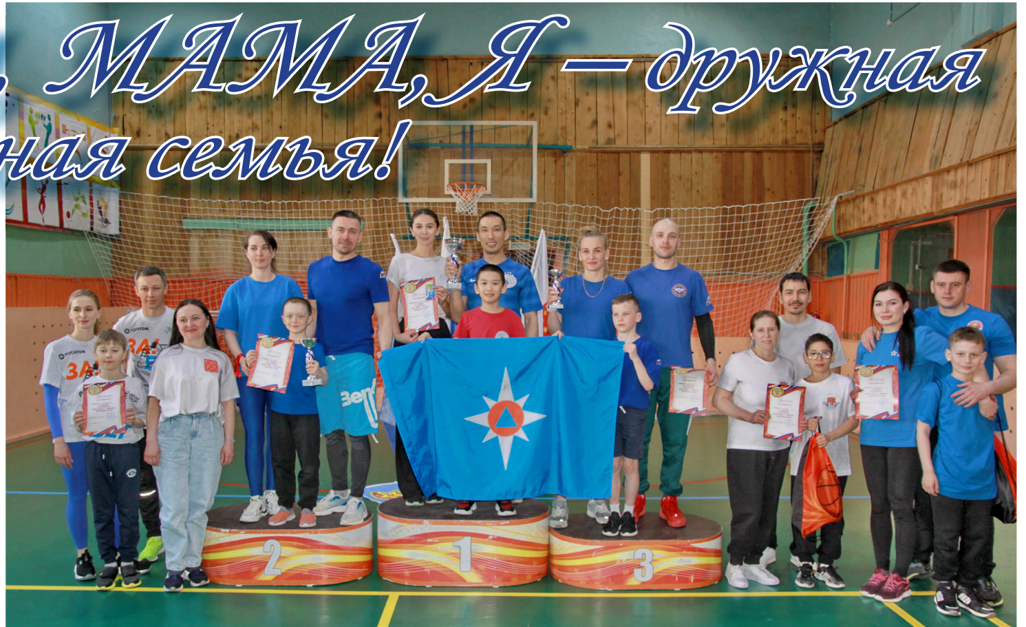
Первая семейная спартакиада – спортивное единство команд-участниц