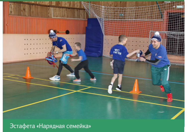
Эстафета «Нарядная семейка»