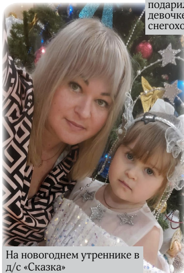
На новогоднем утреннике в д/с «Сказка»