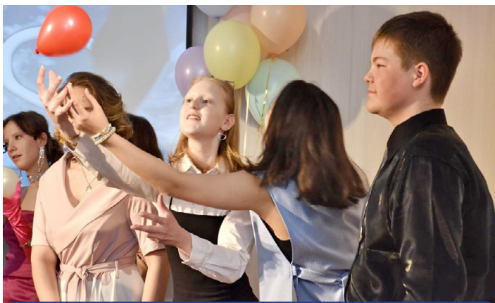
Выпускники Билибинской школы искусств получили в воздушных шарах от своих наставников шуточные предсказания будущего, которые впрочем, могут и успешно для них осуществиться

№ 22 (5997) 7 июня 2024 года. Издательство «Крайний Север» — Билибино. Издается с 13 августа 1965 г. Цена в розницу свободная. Мы ждем ваших новостей по тел.: 2-63-93 bilibino@ks.chukotka.ru