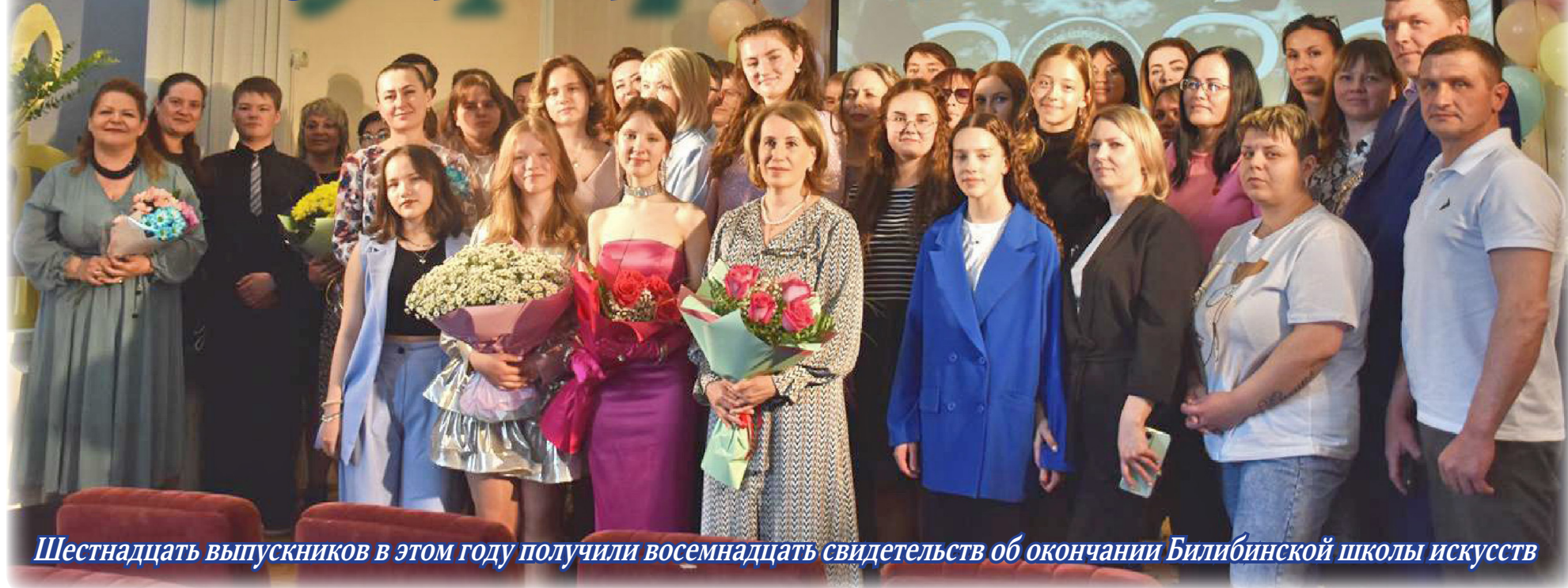
Шестнадцать выпускников в этом году получили восемнадцать свидетельств об окончании Билибинской школы искусств