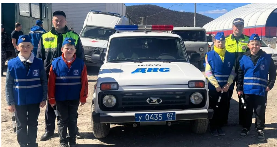
В рамках празднования Дня защиты детей участники школьного отряда ЮИД «Светофорики» совместно с сотрудниками Билибинского ОГИБДД патрулировали территорию около центральной площади