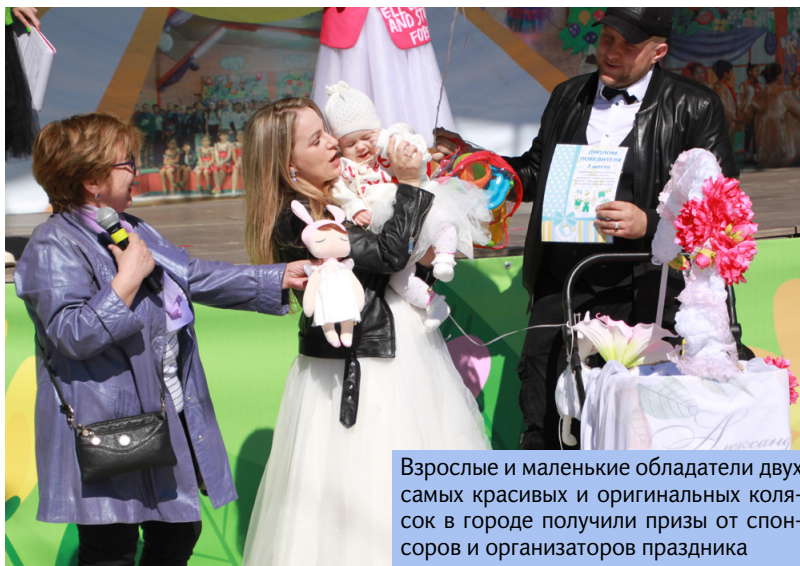
Взрослые и маленькие обладатели двух самых красивых и оригинальных колясок в городе получили призы от спонсоров и организаторов праздника

защитить самый дорогой для любого человека период в жизни – детство!