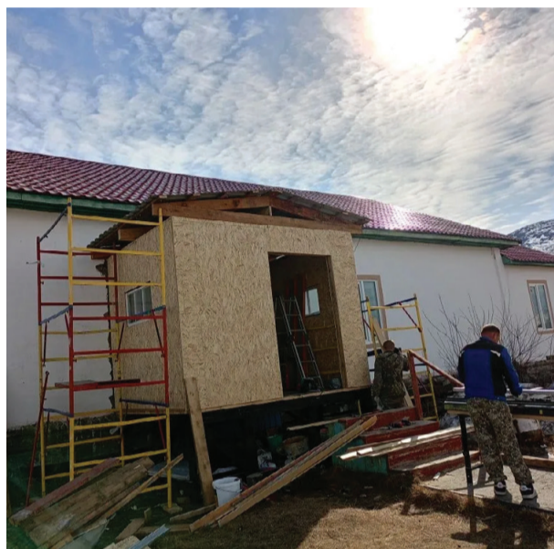
Ремонтные работы в селе Островное

— За 5 лет отремонтированы и оснащены 50 объектов: муниципальные учреждения культуры, библиотеки, музеи, детские