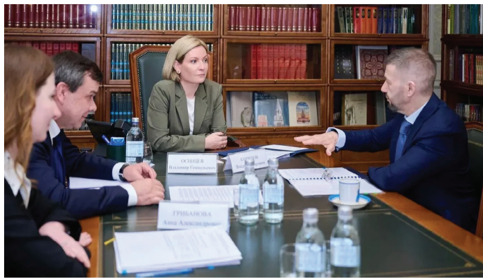
Губернатор Чукотского автономного округа Владислав Кузнецов на встрече с Министром культуры России Ольгой Любимовой

школы искусств, возведено четыре модульных здания Домов культуры. В 2025 году при поддержке Министерства культуры начали внедрение на Чукотке программы «Земский работник культуры», благодаря которой в округ приезжают работать специалисты, — отметил Владислав Кузнецов.