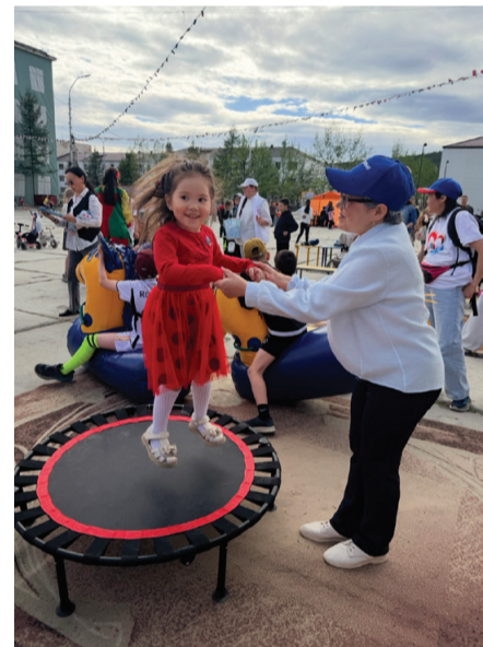
Сотрудники Центра дополнительного образования не только подготовили игровые зоны, но и следили за безопасностью юных билибинцев.

Финал собрал всех в один большой круг. Ведущие позвали зрителей в хоровод, да такой, чтобы с космоса видно было. Площадь закружилась, и праздник закрылся под дружные аплодисменты и обещание новых встреч.