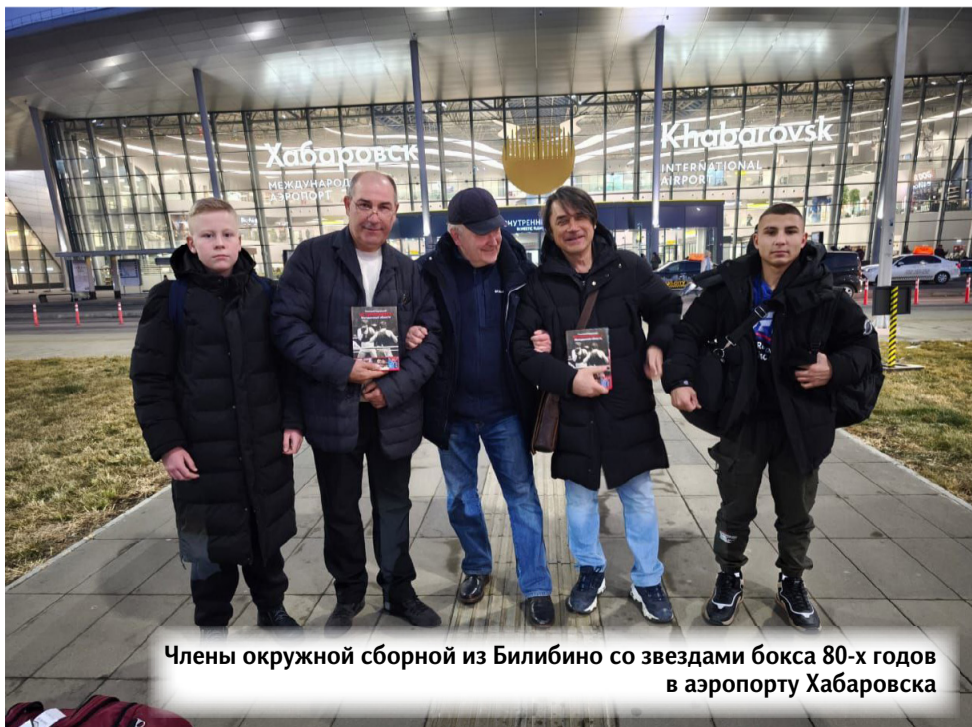
Члены окружной сборной из Билибино со звездами бокса 80-х годов в аэропорту Хабаровска